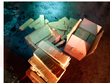
Drogas foram divididas em tabletes, em um total superior a 100 kg

Dentro do veículo, os policiais encontraram 113 tabletes de maconha, pesando aproximadamente 103 kg. O motorista teve pequenas escoriações, foi socorrido e encaminhado para a Polícia Civil de Itajaí.