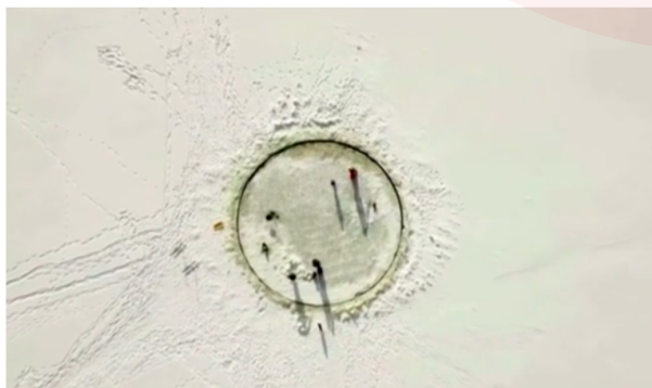
Imagem 2:

Considerando que o carrossel de gelo gire com velocidade angular constante igual a 1,0 \text{ rad/s} e a aceleração da gravidade g = 10 \text{ m/s}^2 , julgue os itens subsequentes.