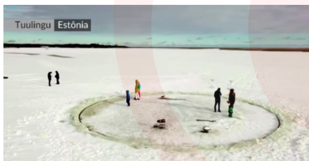
Imagem 1: Retirada do vídeo do site https://www.msn.com/pt-br/entretenimento/noticias/vov%C3%B4-cria-carrossel-de-gelo-na-est%C3%B4nia/vp-BB1dHDz9

Na Estônia, em pleno inverno, um avô construiu um carrossel de gelo para os seus netos. Ele cortou um círculo de 12 m de diâmetro em um lago congelado e instalou um pequeno motor de barco para fazer o carrossel girar. O avô precisa refazer parte do carrossel diariamente, já que as temperaturas são extremamente baixas durante esta época do ano.