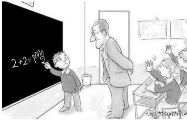
CONTI OUTRA. 50 melhores charges já publicadas na Conti Outra. Disponível em: < https://www.contioutra.com/50-melhores-charges-ja-publicadas-na-conti-outra/ >. Acesso em: 20 jan. 2025.