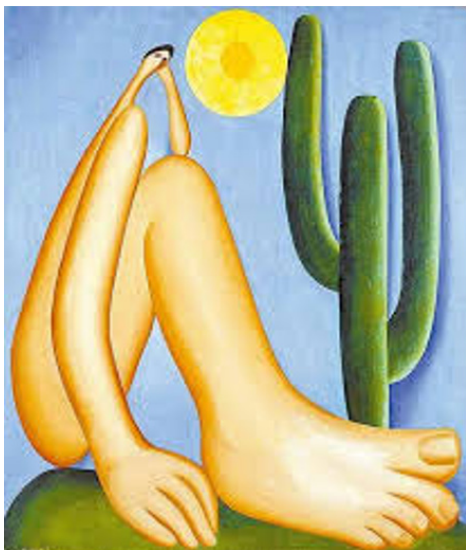
Tarsila do Amaral. Abaporu.

Abaporu é uma pintura modernista e, por isso, apresenta elementos nacionalistas . Assim, é possível perceber a presença das cores verde, amarelo e azul. Essas cores estão na bandeira do Brasil e, portanto, representam a nossa nacionalidade. Já a figura humana representada na tela tem a cor morena, símbolo da miscigenação brasileira.